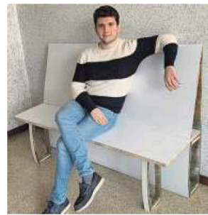
Costa, con un banco hecho en O Porriño.

su propia marca, que es Sostylair (concepto que suma los de sostenibilidad, estilo y aire).