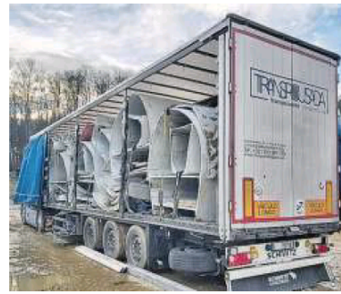
El material se corta en el parque antes del transporte.